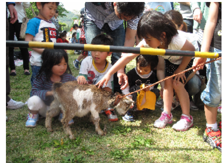
動物のこども紹介