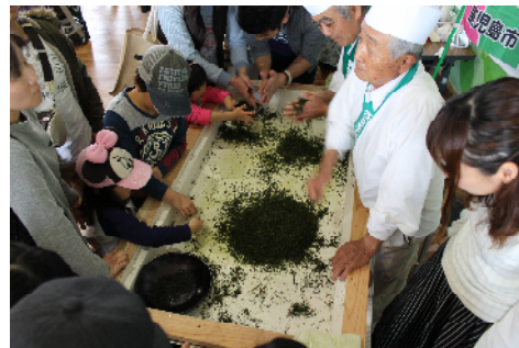
お茶の手もみ体験