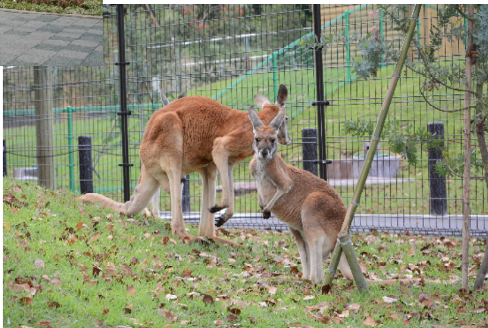
平川動物公園「オーストラリアの自然ゾーン」