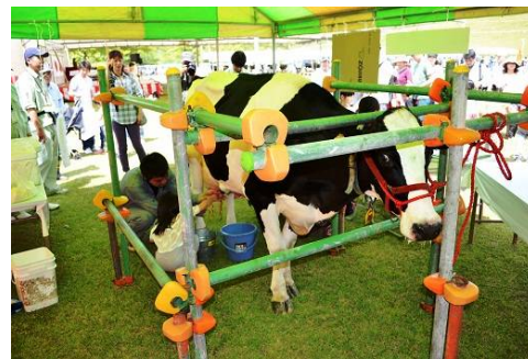
昨年の農林水産春まつり