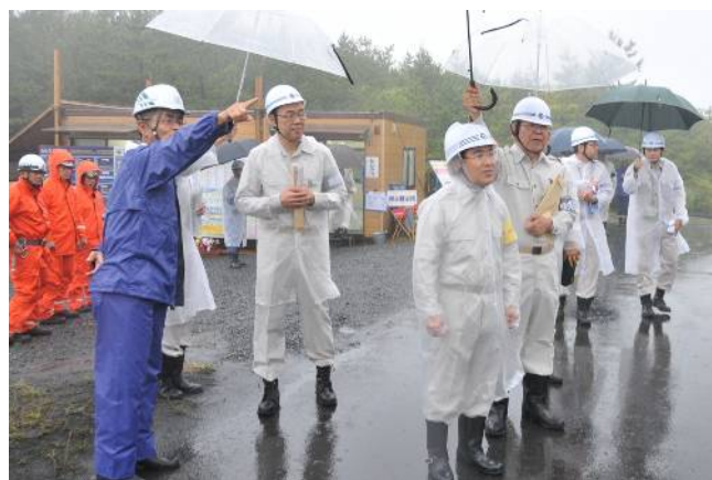
平成26年度防災点検（第二有村川砂防工事）