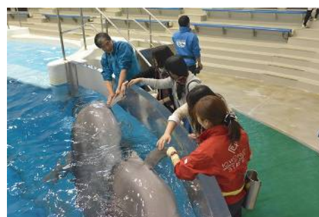
みんなでイルカにタッチ