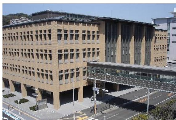
鹿児島市役所本庁舎西別館