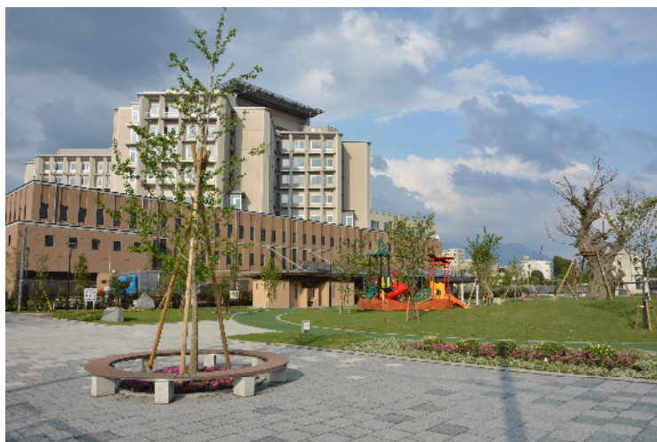
上荒田の もり 杜公園と市立病院