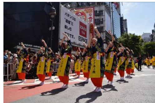
昨年の渋谷・鹿児島おはら祭