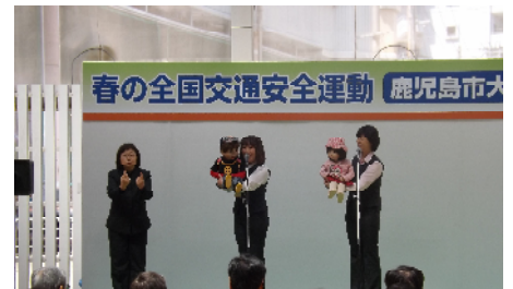
昨年の春の全国交通安全運動鹿児島市大会 [場所：天文館ベルク広場]