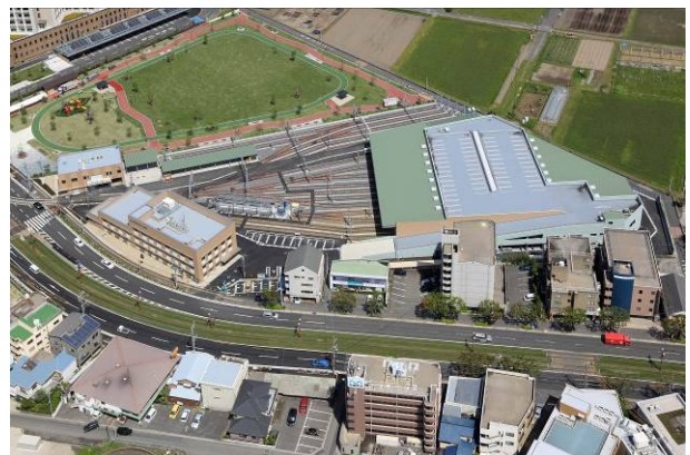
供用開始を間近に控えた交通局舎等