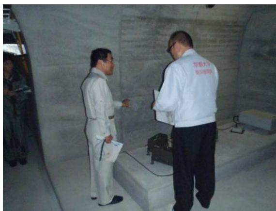
平成26年度防災点検（有村観測坑道）

※遊砂地…山あいの川などの低いところを使って、砂防施設で止めた土や砂を溜めておくところ。