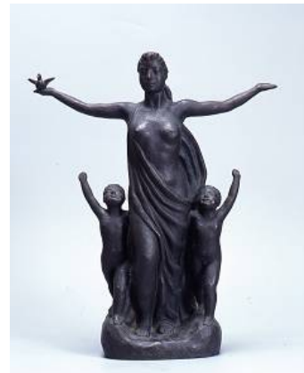
復興平和記念像(樽谷清太郎) ※北九州市立美術館蔵