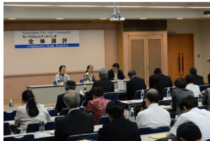
講評（プレ現地審査）