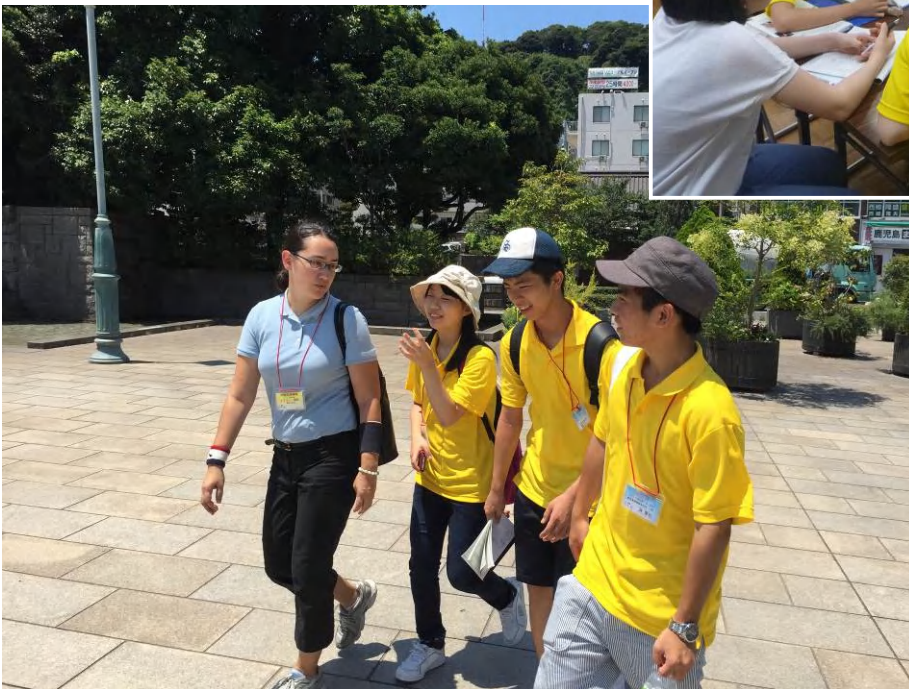
かごしま創志塾（第1ステージ）の様子