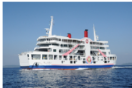
サクラフェアリー