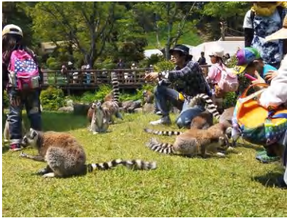
好きな動物にエサをあげよう