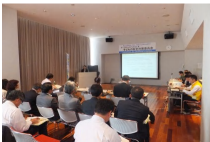
審査（プレ現地審査）