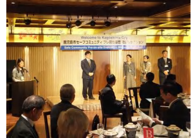
概要説明・意見交換会（プレ現地審査）