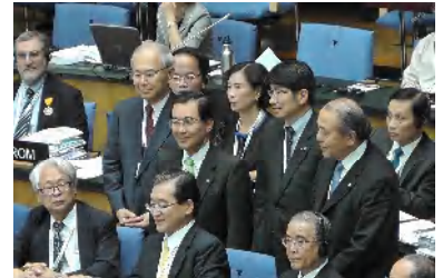
「明治日本の産業革命遺産」世界文化遺産に登録決定（7月5日）