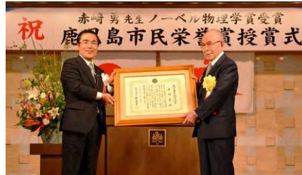
赤崎勇氏への鹿児島市民栄誉賞の授与 (6月25日)