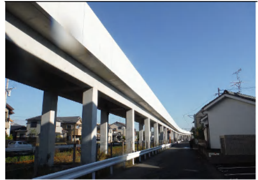
谷山地区連続立体交差事業高架