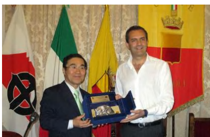
ナポリ市との姉妹都市盟約 55 周年に伴う記念訪問（8月5日）