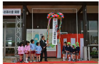
都市農村交流センターお茶の里オープン（3月20日）