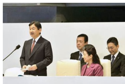
第30回国民文化祭・かごしま2015の開催（10月31日～11月15日）