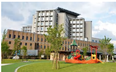
上荒田の杜公園オープン(4月17日) 市立病院移転開院(5月1日)