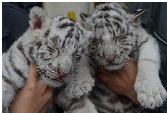
11月に生まれたホワイトタイガーの赤ちゃん