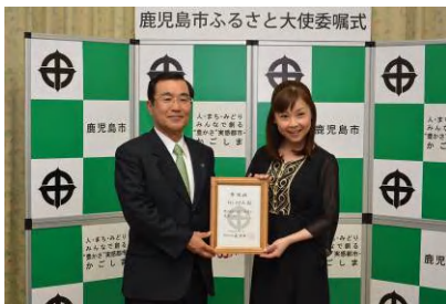
はしのえみ氏への鹿児島市ふるさと大使の委嘱（2月3日）