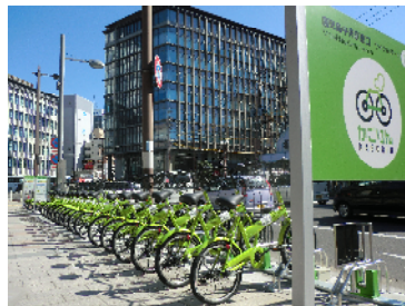
コミュニティサイクル「かごりん」スタート(3月1日)