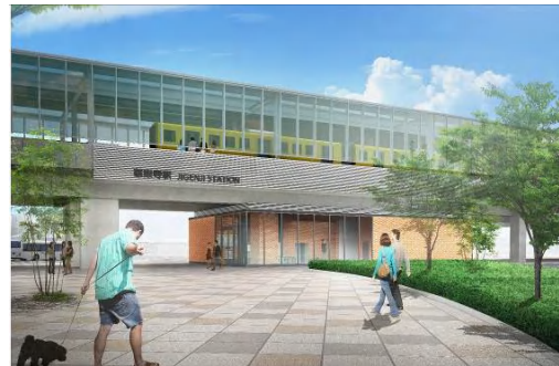
慈眼寺駅舎完成予想図