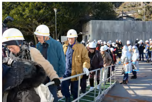
平成26年度 桜島火山爆発総合 防災訓練の島外避難訓練の様子