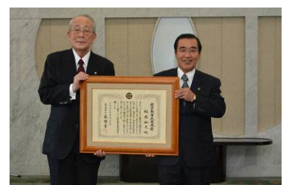
稲盛和夫氏への市民栄誉賞の授与 (11月16日)