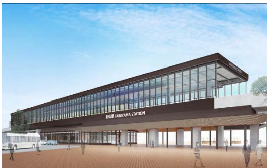
谷山駅舎完成予想図