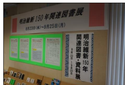
明治維新150周年関連図書展