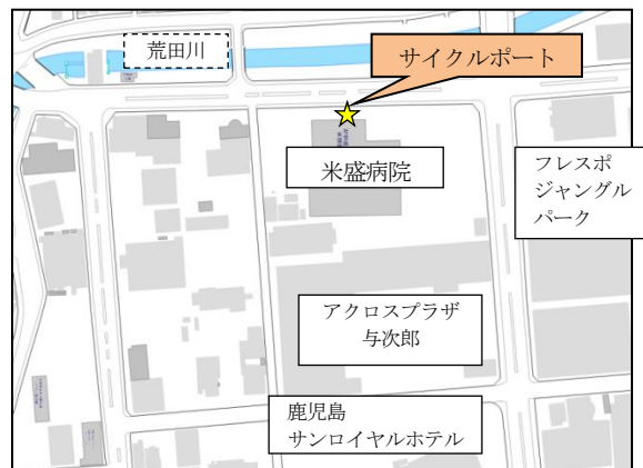
サイクルポート周辺図