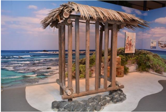
ロケセット（屋外牢）の一部再現

5月からドラマの舞台が、奄美などの島々に移ったことにあわせて、5月28日（月）から展示を一部リニューアルした。