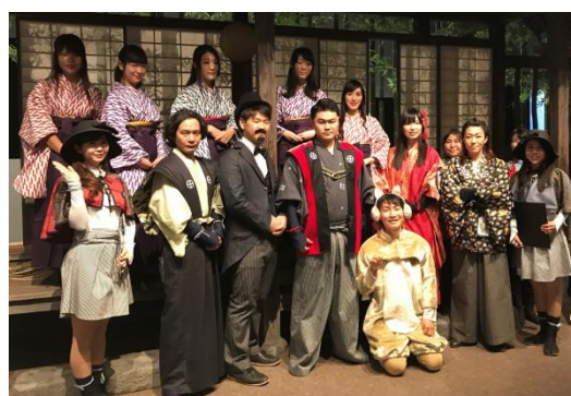
「薩摩こんしえるじゅ。」と「まちなかおもてなし隊」