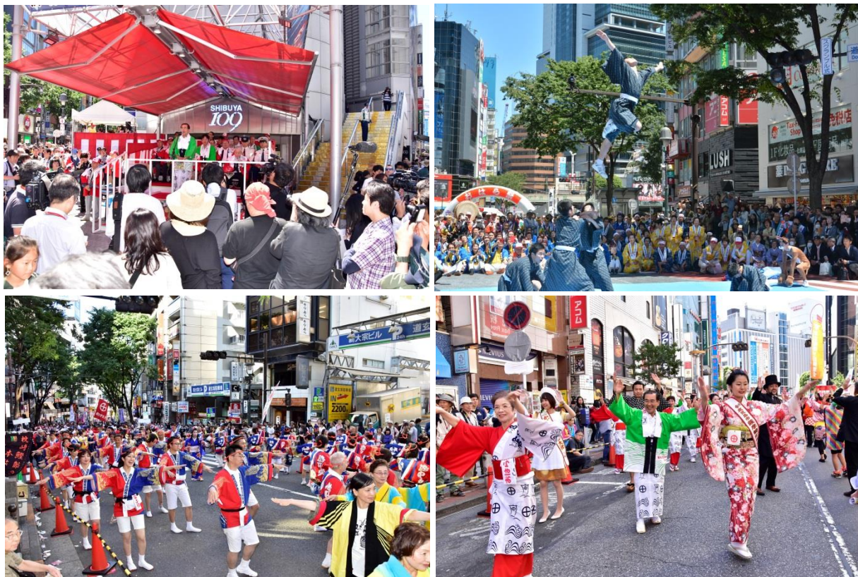
明治維新150周年記念 第21回渋谷・鹿児島おはら祭（5月20日）