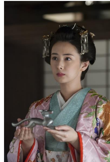
第13話で篤姫（北川景子）が着用した打掛

ドラマの中で使われた印象的な小道具などを展示する。 6月は、篤姫がお輿入れする日に着用した打掛や、 婚礼支度品の化粧道具などを展示。