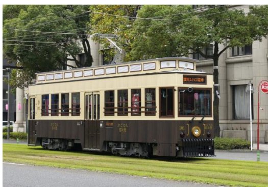
観光レトロ電車「かごでん」