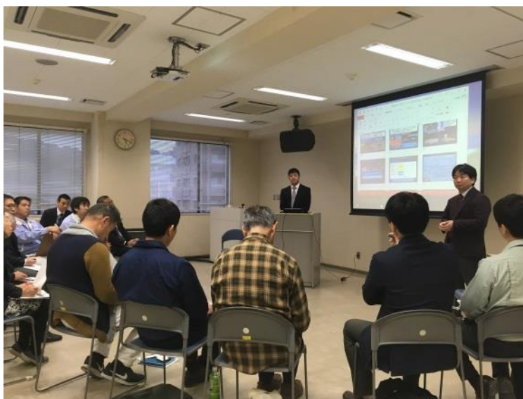
昨年度、試験的に開催したときの様子