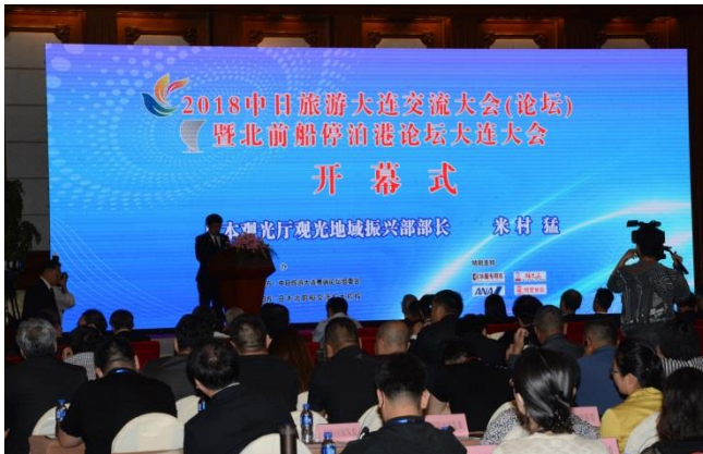
「北前船寄港地フォーラム in 大連」の開幕式

内 容 日本、中国両国から、あわせて約50自治体、約850人が参加し、日本と中国との海を越えた交流の拡大に向け、北前船に関するフォーラム、レセプションが開催 ※インバウンド取り込みなどを目的にして初の海外での開催