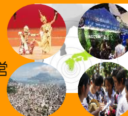
初代 “アツア・ 鹿児島” イノベーション 戦略策定 事業