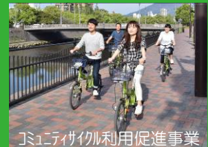
コミュニティ利用促進事業