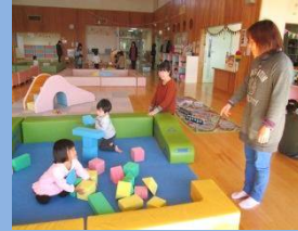
子どもの 未来 応援事業