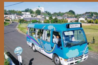
公共交通 不便地対策 事業