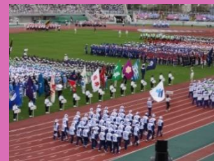
第75回 国民体育大会 等準備事業