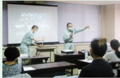
[水道モニター会議の様子]

水道局では、「水道モニター制度」により、上下水道に対するお客様の要望や意見等をお聞きしています。 モニターの皆様からいただいた貴重なご意見等は、事業運営の参考とさせていただきます。