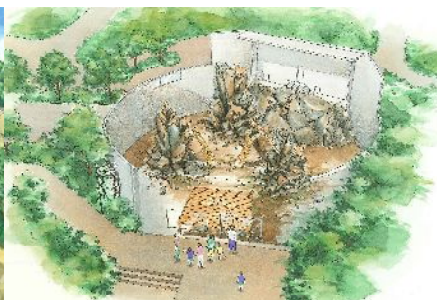
マントヒヒ・バーバリーシープ展示場