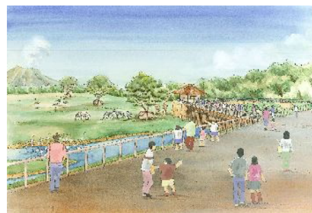
アフリカの草原ゾーン①

(注1) マントヒヒ・バーバリーシープ展示場、アシカ・ペリカンプールは一部観覧できない箇所があります。