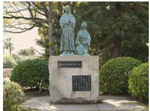
坂本龍馬新婚の旅碑

「坂本龍馬新婚の旅碑」がある鹿児島市天保山町は、龍馬とお龍が桜島丸に乗船し、多くの人に見送られながら薩摩を後にした地です。