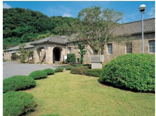
旧集成館機械工場（尚古集成館）

旧集成館（国史跡）、旧集成館機械工場（国重要文化財）、旧鹿児島紡績所技師館の3つの史跡は「九州・山口の近代化産業遺産群」の一部として世界遺産暫定リストに記載されています。