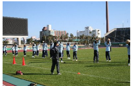
Jリーグ・ジュビロ磐田