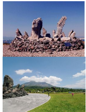
「叫びの肖像」と赤水展望広場