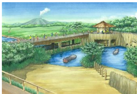
アフリカの草原ゾーン②