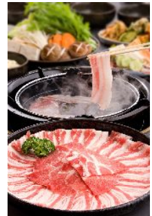
黒豚しゃぶしゃぶ

鹿児島産黒豚は、筋繊維が細かで、他の豚肉より脂肪の融点が高く、アミノ酸などの旨味成分を多く含むといった特徴を持ち、「柔らかくて歯切れがよい」「さ