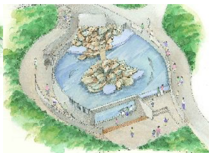
アシカ・ペリカンプール