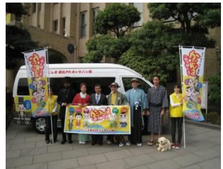
かごしま観光PRキャラバン隊出発式