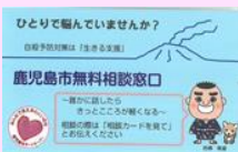
無料相談窓口カード→