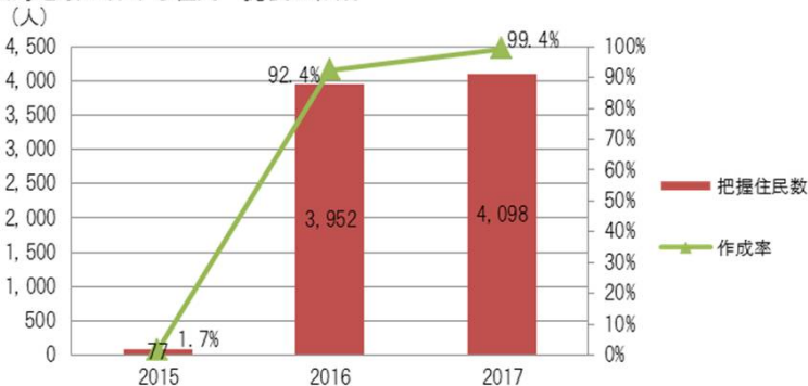
【出典】桜島大規模噴火時の全島避難に関する調査ほか 【データ】桜島住民、両性、全年齢、2015～2017年度