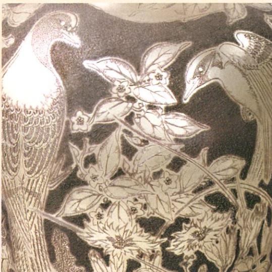
帖佐美行《爽陽想》(部分) 1983年