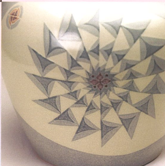
宮之原謙《彩盛磁かざぐるま壺》(部分) 1975年