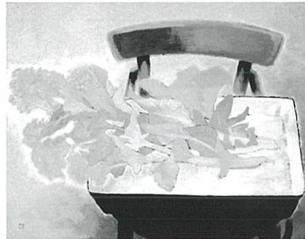
満田天民《菜の花》1954年