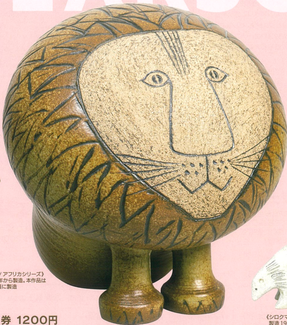
《ライオン(マキシ) / アフリカシリーズ》 本モデルは1968年から製造。本作品は 1968-1980年頃に製造