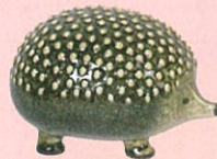
《ハリネズミ / 危機に瀕した 動物たちシリーズ》 製造 1979年