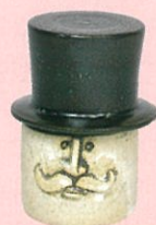
《紳士の蓋付容器 (ユニークピース)》 1982年