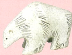
《シロクマ / 大きな動物園シリーズ》 製造 1958-1970年