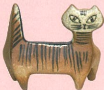
《立っているネコ / 小さな動物園シリーズ》 製造 1956-1978年