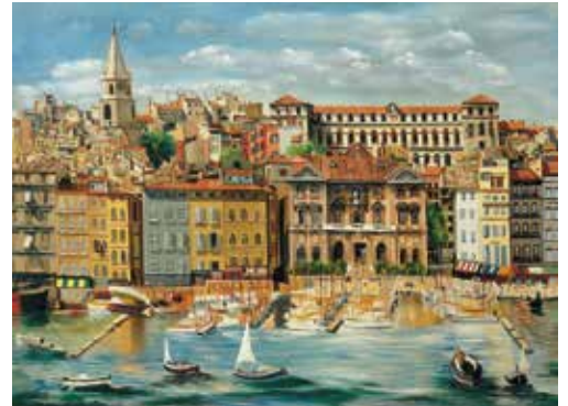
《マルセイユ》1940年 プティ・パル美術館 / 近代美術財団、ジュネーブ