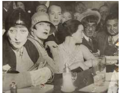
1920年 カフェ・ド・ラ・ロンド (右端がキスリング、その左隣は藤田嗣治)

鹿児島市立美術館 〒892-0853 鹿児島市城山町4-36 Tel.099-224-3400 http://www.city.kagoshima.lg.jp/artmuseum/