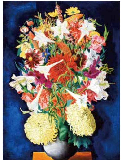
《花》1934年 個人蔵