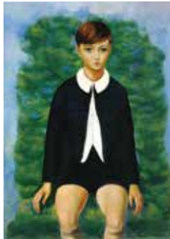
《ル・ベック氏の息子》1926年 熊本県立美術館