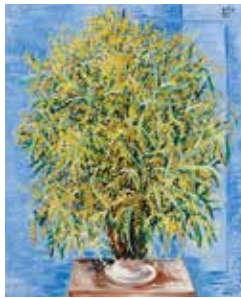
《ミモザの花束》1946年 / 市立近代美術館