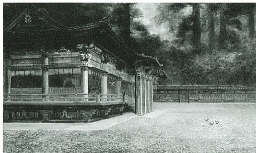
曾山幸彦《上野東照宮》1890 年頃、油彩

洋画の黎明期である明治時代、工部美術学校でイタリア人画家に師事した曾山幸彦をはじめ、イタリアに留学した有島生馬、藤島武二、イタリアの近代美術運動「未来派」と交流した東郷青児などが挙げられます。