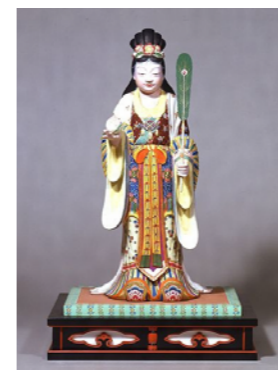
新納忠之介《西王母》 1950 年