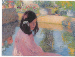
アンリ・マルタン (女) 1919年12月 イゾラ・ベッラフゾウだ、タームール博物館, Inv.418

わたしは、この糸会を見て 思いました。この糸会は、 げんじつ世界見たいに、池に 花や木がうつっていました。 わたしは、ここまでさいげん できているアンリ・マルタン という人がすごいなあと思 いました。