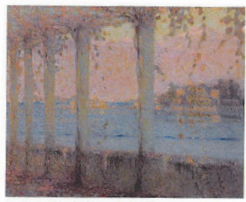
アンリ・マルタン (女) 1919年12月 イゾラ・ベッラフゾウだ、タームール博物館, Inv.418

わたしは、この糸会を見て 思いました。この糸会は、 げんじつ世界見たいに、池に 花や木がうつっていました。 わたしは、ここまでさいげん できているアンリ・マルタン という人がすごいなあと思 いました。