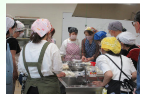
【城西ふっくらパン工房】