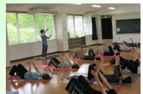
【わたしにもできる初めてのヨガ教室】