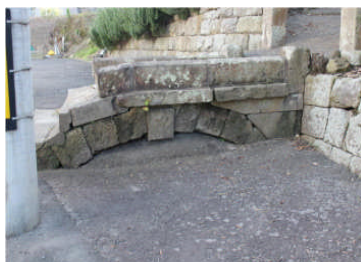
写真2：石井手用水の石橋

1806年(文化3年)甲突川の上流、伊敷村の飯山橋の上手に石堰を設けて、川水をたたえ、その水を小野、永吉、原良、西田、武等を経て、荒田までひきました。