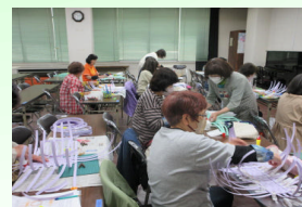
【初心者のためのエコクラフト】