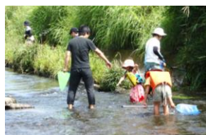
【田上川調べ歩きの様子】

親子で一緒に、活動することで、親子の触れ合いが増え、新たな発見が期待できる講座になっています。