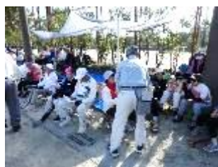
【和やかな交流の様子】

7月号は、電子版のみの発行 です。各校区のコミュニティ・まちづくり協議会事務局(校区公民館内)に紙面(白黒版)を配布しておりますので、御希望の方は各校区公民館にお立ち寄りください。