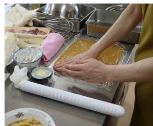
【楽々おうちごはんIの様子】

また、この2講座は託児有の講座でした。託児を利用された方は「子供を預かってもらい、しっかり学ぶことができ、うれしかったです。感謝しています。」とお話してくださいました。