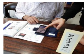
【はじめてのスマホの様子】