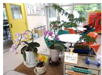
【公民館ロビーの様子】

皆様が、ロビーにいらしたときに、自然に包まれ、癒しの空間を感じていただくとうれしく思います。