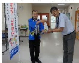
【公民館にひまわりを】

さて、本館では、11月8日(金)に人権問題研修会を計画しております。本研修会では、人権問題について学び、人権について理解を深めていただきたいと思いますと考えております。本研修会に、より多くの皆様に参加していただくと幸いです。