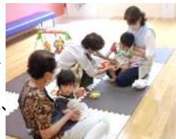
【託児ボランティアの様子】