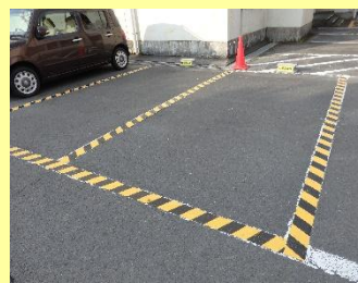
【優先駐車スペース】

このたび、劣化してきた表示や塗装、テープをリニューアルしました。さらに軽自動車専用駐車場の表示もより見やすくしました。