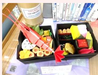
【折り紙のおせち料理】

だくことに心から感謝いたします。本に興味を持たれ、手に取って読んでいただく、あたたかい図書室づくりに、これからも取りこんでまいります。