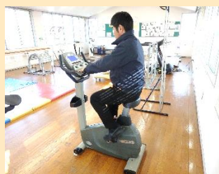
【エアロバイクの様子】