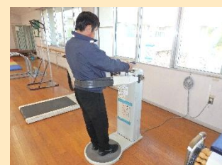
【ベルトトレーナーの様子】