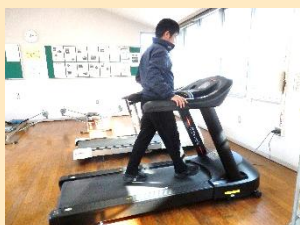
【ルームランナーの様子】