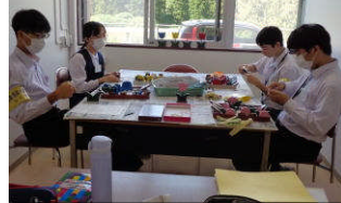
チューリップの色付け