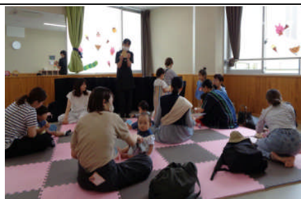
託児室でのおはなし会の様子

また、家庭教育支援ボランティア「マラカスの会」が文部科学省の家庭教育支援チームに登録されました。「マラカスの会」は月1回松元公民館で活動しています。「家庭教育支援チーム」は、地域の多様な人材を中心に組織し、保護者への相談対応、情報提供と交流などを行っています。子育てのことなどで気がかりなことがありましたら、遠慮なく御連絡ください。