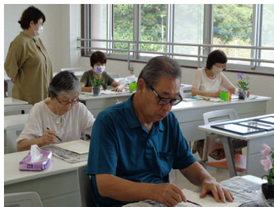
自主学習グループでの活動の様子

毎月第2土曜日の10:00～12:00に今よりも少し絵がうまくなりたい8人で活動しています。講師の指導の下、構図を考えてデッサンをしたり、色の構成やグラデーション、明暗を考えたりしながら描くのが楽しいです。また、会員同士できあがった作品を鑑賞し、合評し合うことで、さらに向上心を掻き立てられ、次回へ向けての意欲につながっています。公民館まつりでの展示発表もしたり、公民館1階にも展示したりしていますのでぜひご覧ください。また、絵に興味のある方はぜひ一緒に描きませんか。