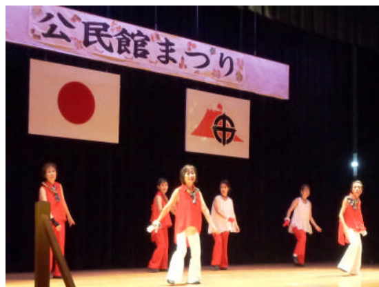
公民館まつりで舞台発表の様子

毎月第2・第4金曜日の10:00～11:30の時間帯にジャズダンスを通して、健康の保持増進と会員の親睦を目標に11人で活動しています。講師からストレッチやステップの指導をしてもらい、曲に合わせて、リズムに合わせてみんなで楽しく踊っています。時には、地域でジャズダンスを披露することもあります。心身の健康と脳の活性化、ボケ防止にも効果があると実感しています。皆さん、健康のために一緒にジャズダンスをしませんか。いい汗をかいて気分爽快です。興味のある方お待ちしております。