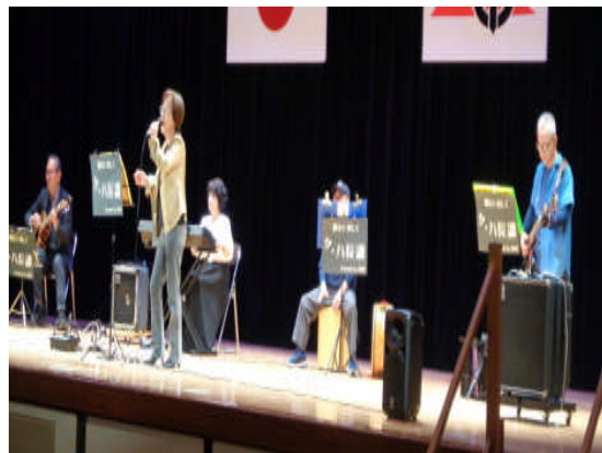
公民館まつりで舞台発表の様子

毎週金曜日の9:00～11:00の時間帯に音楽の練習をしています。メンバーは5人でボーカル・ベース・リード・キーボード・パーカッションです。公民館まつりでの舞台発表や松元地域の老人福祉施設、敬老会、夏祭り等に参加して演奏させてもらっています。レパートリーは演歌から歌謡曲（懐メロ）、ニューミュージック、カントリーなど幅広く練習しています。メンバーの音感の調和を図り、指先の動きとも相談しながら楽しく活動しています。興味のある方は、毎週金曜日にお待ちしております。見学だけでも構いませんよ。