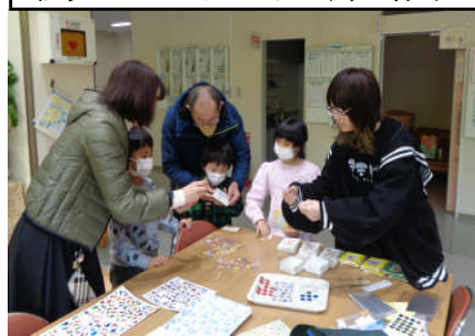
マラカスの会ワークショップ