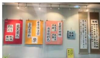
【書友会の皆様の作品】

自主学習グループ書友会の皆様の作品が、「つばめロード市民ギャラリー」に展示されました。