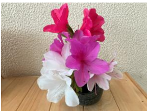
【駐車場を色どるつつじ】

公民館は、元気な来館者に加え、春の花や生き物で活気あふれています。新たな学びを求めて、ぜひ、武・田上公民館へお越しください。