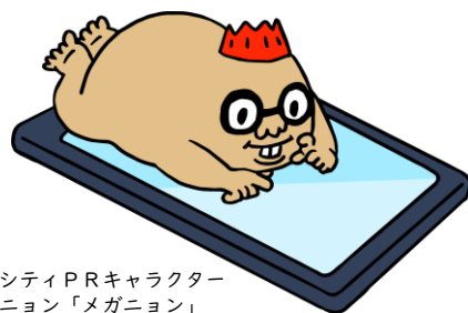
マグマシティPRキャラクター マグニョン「メガニョン」