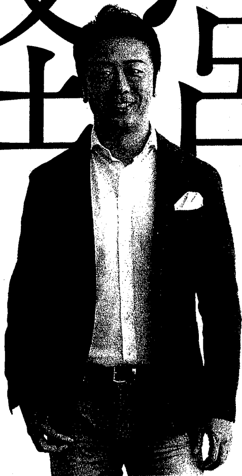
福岡市長 高島宗一郎