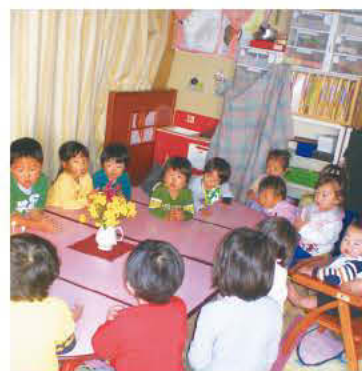
認可外保育施設の様子

範囲内で、月額の上限が千円から1万6千円までとし、上限額は認可外の平均保育料と認可の保育料の差額の2分の1としている。補助要件は、市内に住所を有し、保護者が就労等により、日中、家庭で保育ができないことなどである。