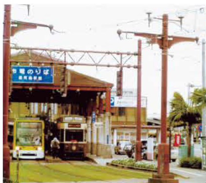
整備予定のJ R鹿児島駅周辺

答 屋根付きイベント広場や芝生広場など、各ゾーンの施設の具体的な規模や配置等について検討し、施設基本計画の作成等を行うとともに、中核的な複合施設を検討するため、基礎調査を実施する。基盤整備については、施設管理予定者のJ R九州と協議等を行うに当たって必要な駅舎や自由通路の基本計画、概算事業費の算出等について調査検討を実施する。