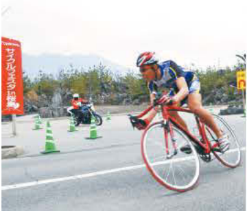
タイムトライアル競技

答 「サイクルフェスタin桜島」は、鹿児島市のシンボル「桜島」を舞台に、本市で初めて開催された大会である。200人を超える競技者が、タイムトライアル、ヒルクライムの競技に挑戦したが、日本を代表する選手も出場し、迫力ある走りを見ることができた。参加者のみならず、観客の方々にとっても魅力ある大会になったと思っている。今後、この大会が鹿児島を代表するスポーツイベントの一つとして定着するとともに、開催を通じて、鹿児島市の魅力が広く情報発信されることを期待している。