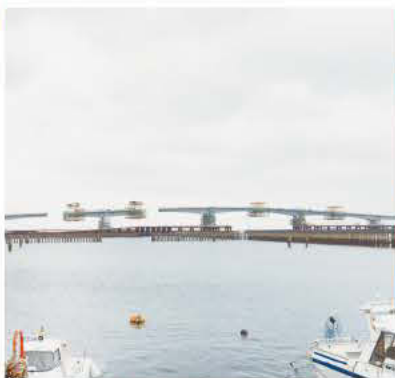
整備中の臨港道路橋りょうC

答 橋りょうC整備の進捗よく状況は、国によると、「現在、上部工の施工中で北側の2径間が完了し、残り6径間の架設を行っている。上部工架設完了後、残りの橋面や取り付け道路の舗装を行い、26年の供用開始を目指している」とのこと。整備効果は、交通渋滞の緩和による環境負荷の軽減や人流・商業そして企業活動の活性化など広域的な経済活性化が図られる。