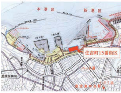
住吉町15番街区周辺の地図

答 本市が国際観光都市として発展していくためには、本市が持つウォーターフロントという特性を生かしていくことも重要であり、当該土地が有する特性を最大限に生かし、回遊性やまちづくりの観点から賑わいを創出するような活用が図られるべきと考えている。また、当該土地を含む本港区背後地のロケーションや地理的特性が生かされるよう、今後、土地利用について、検討を進めていきたい。