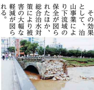
8・6水害で崩壊した武之橋

その効果 として、治山事業により下流域の保全が図られたほか、総合治水対策により被害の大幅な軽減が図られる。