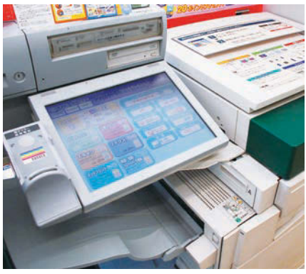
証明書が取得できるようになるコンビニ端末

の6種類で、本年8月から、本庁および各支所の窓口において、住基カードへの利用者登録を開始し、平成26年1月14日からコンビニ交付を開始する予定である。