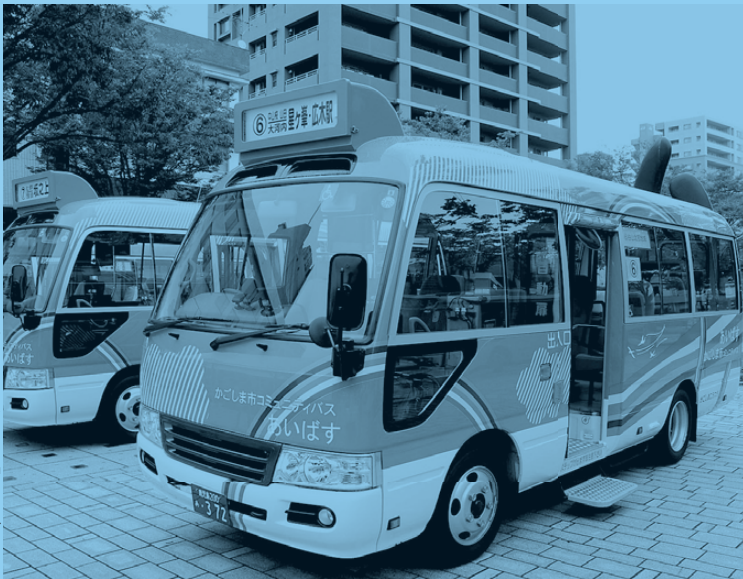
▶ コミュニティバス「あいばす」