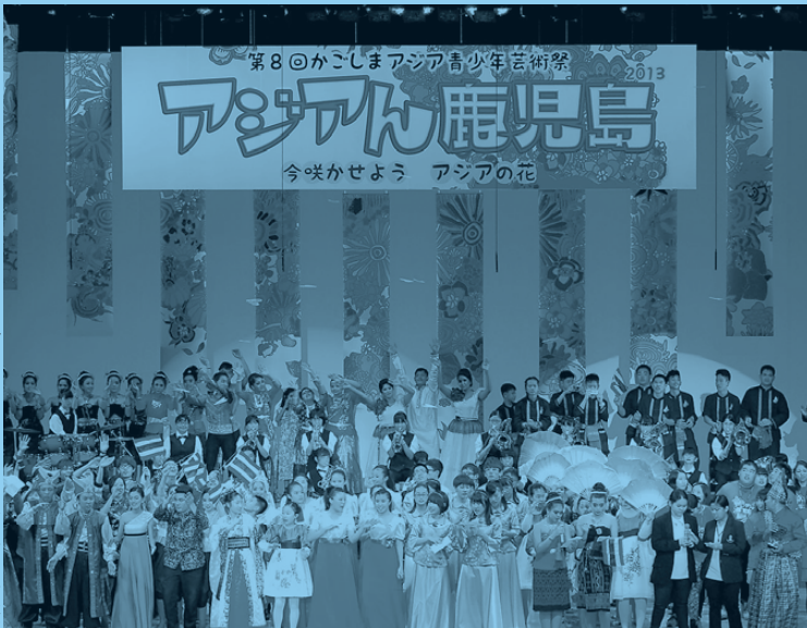
▶ 第8回かごしまアジア青少年芸術祭