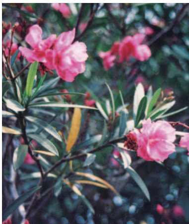
市 花 きょうちくとう

( 構 成…市旗の構成は、白色の地に黒色の市紋章 (昭和42年鹿児島市告示第5号)と赤色 の桜島の図形を配する。 規 格…縦2、横3の比率とする。 )