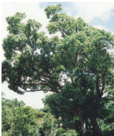
市 木 くすのき