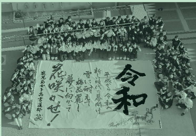
▶ 鹿兒島女子高書道パフォーマンス作品