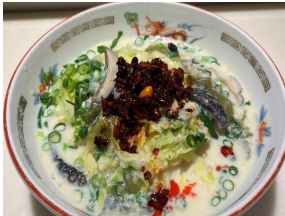
こむらさき薬膳麻辣麺 (ラーメン専門こむらさき 天文館店)