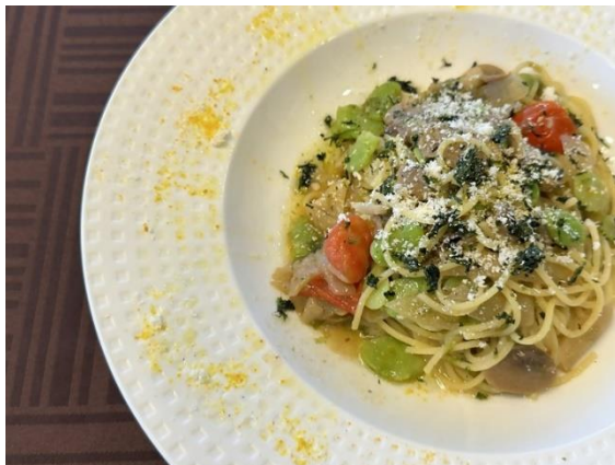
薩摩の香り ～桜島大根とアオサの彩りパスタ～ (I L MOLE)