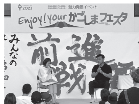
城彰二さん（元サッカー日本代表・サッカー解説者）