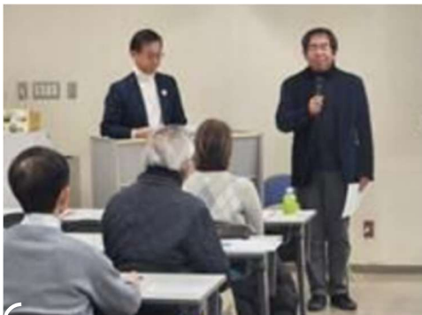
（講座）～次の10年を見据えて～