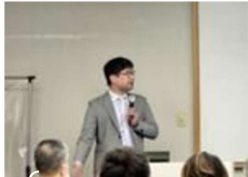
（講座）幕末薩摩の炭づくり