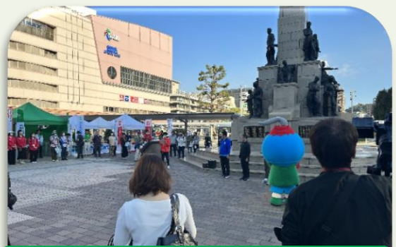
ひろウォーク開会セレモニーの様子