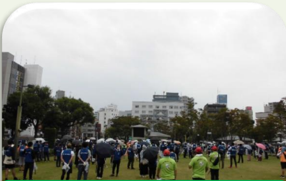
天文館クリーン作戦開会式の様子

鹿児島市内を歩きながら、ごみを拾ってまちをきれいにするにより、鹿児島市の魅力を感じてもらうとともに、景観資源をきれいに保つことの重要性や意義に触れ、美しいまちづくりへの意識が高まるような活動となりました。