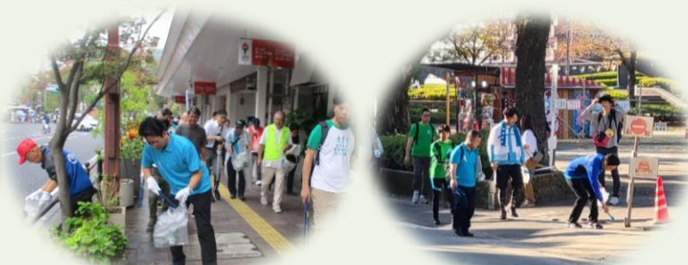
下鶴市長も参加しました。