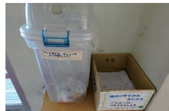
ペットボトルキャップ・古紙回収