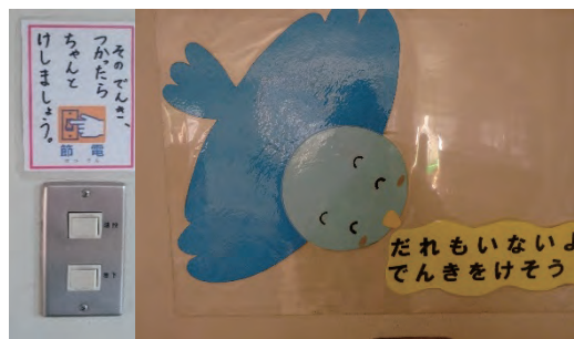
節電・節水を呼びかけるステッカー

昼休みは教室の電気を消す、バケツでぞうきんを洗うなどできることを日々実践しています。