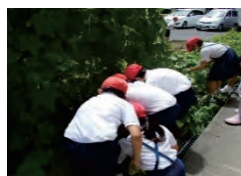
【朝のボランティア活動】