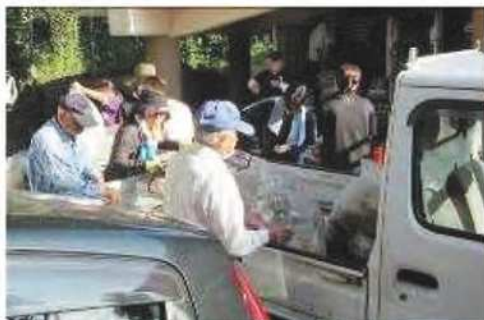
<校区リサイクル活動>