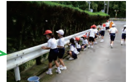
【ガードレール清掃】