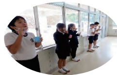
【歯磨き時コップ使用】