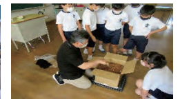
【生ごみコンポストの取組】