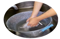
【掃除時バケツ使用】