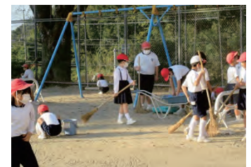
【けやきの落ち葉でたい肥作り大作戦】

けやきの落ち葉がたい肥になって、学校の花壇を花いっぱいにしてくれるのが楽しみです。