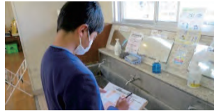
【エコチェックの様子】