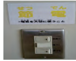
【スイッチ付近の掲示】