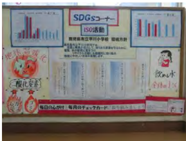
環境ISO活動コーナー (1階玄関付近の廊下)