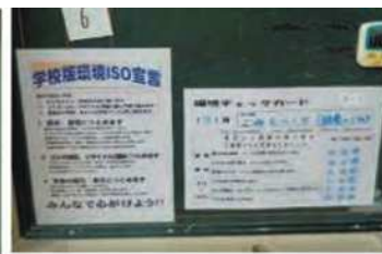
(環境ISO宣言と月ごとのチェックカード)