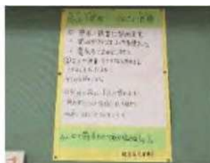
(名山小学校環境目標)

名山小学校では、環境委員会が中心となって、全児童・全職員で節電・節水、マイ箸持参運動、ごみの減量、リサイクル、環境美化に取り組んでいます。