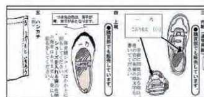
図3 所持品の記名方法の仕方

持ち物の記名の仕方について「所持品の記名方法の仕方」を基に、具体的な記名の仕方について全学級で継続的に指導を行っています(図3)。これにより、全学年で記名する習慣が身に付き、落とし物の量を減らすことができました。