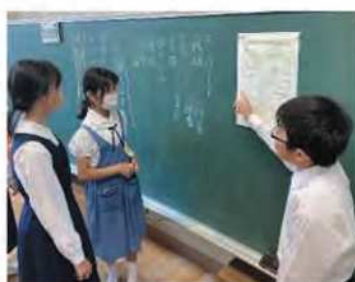
写真1 委員会活動での話し合い

話し合い後は、各学級の手洗い場近くに「附属小学校環境方針」を掲示し(図2)、学校全体で歯磨きやおぼん洗いに使う水の量を減らそうとする意識をもつことができました。