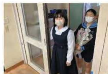
写真2 古紙回収の様子

これらの取組を続けることで、燃やせるごみとしての紙ごみの量を減らすことができました。