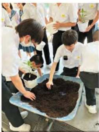
年2回実施する一人一鉢運動