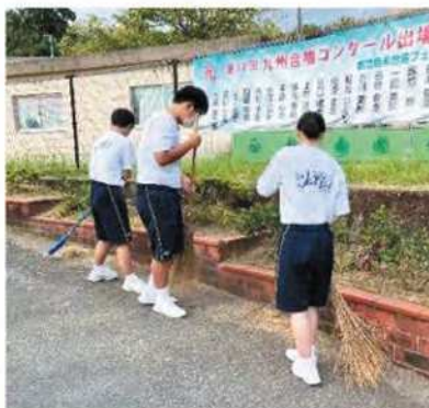
朝のボランティア清掃