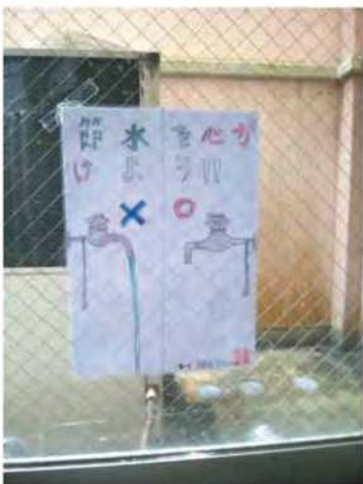
節水をよびかける ポスターの作成