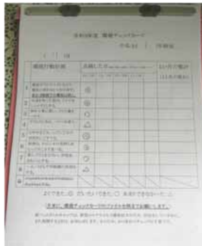
【環境チェックカード】