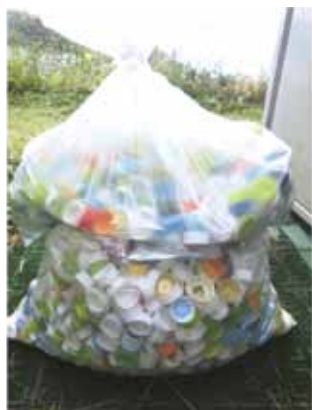
【ペットボトルキャップの回収】

栽培・美化委員会が中心となり、ペットボトルキャップの回収に取り組んでいます。 児童の目に留まりやすいように、各教室にペットボトルで作った回収箱を設置しています。