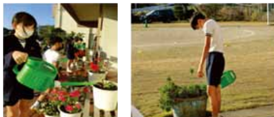
【花のあふれる学校づくり】

栽培・美化委員会を中心に緑化活動に取り組んでいます。 学級園や一人一鉢の世話をし、きれいな花をさかせています。