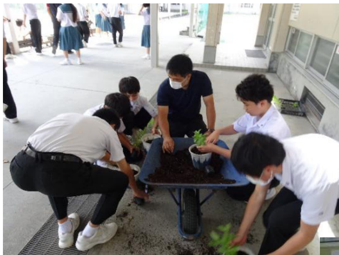
年2回実施する一人一鉢運動