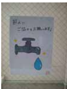
節水をよびかけるポスターの作成