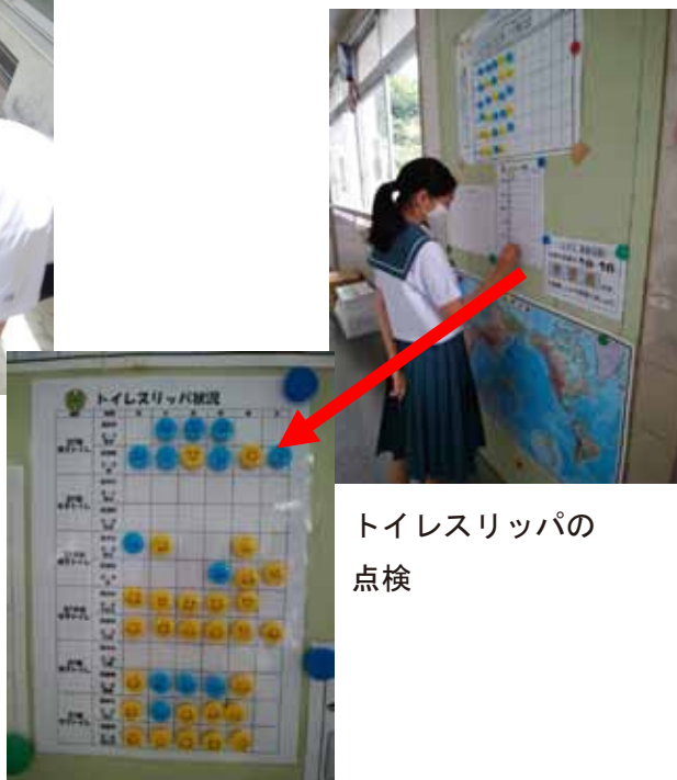
トイレスリッパの点検