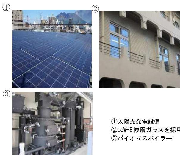
①太陽光発電設備 ②LoW-E複層ガラスを採用 ③バイオマスボイラー