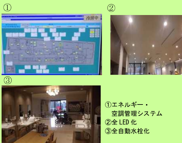
①エネルギー・空調管理システム ②全LED化 ③全自動水栓化