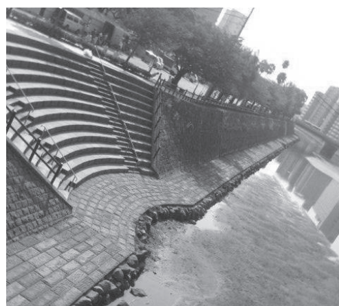
● 親水の階段と散策路