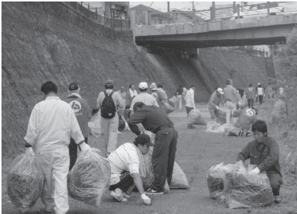
● 甲突川クリーン作戦

快適な水辺環境を確保するため、市民などに対するゴミの不法投棄防止の啓発、市民団体などと連携した河川の美化・清掃に努めています。