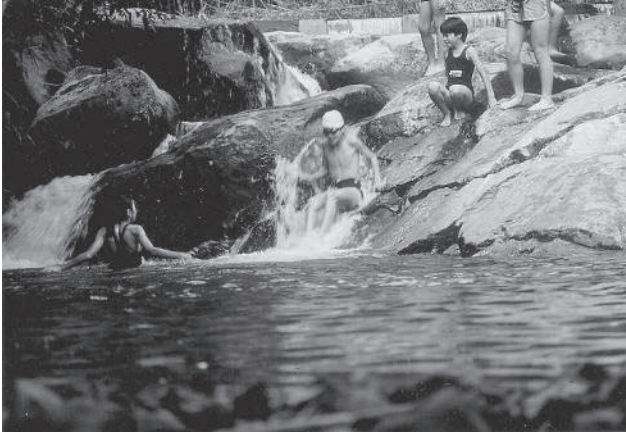
● 宮川野外活動センターでの親水