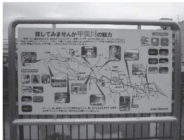
● 河川愛護意識啓発看板