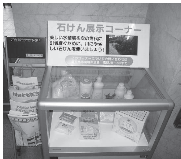
● 石けん展示コーナー（支所等に配置）