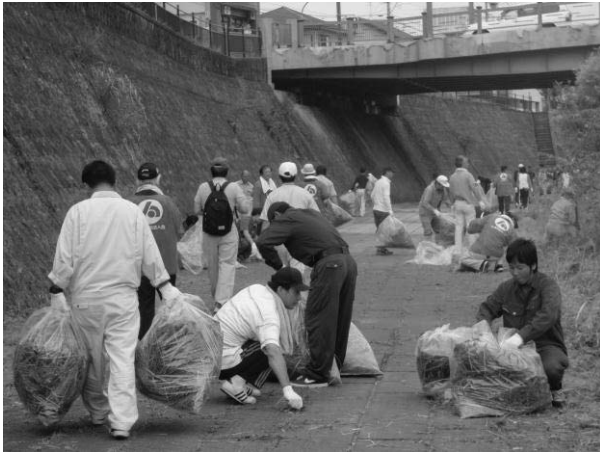
● 甲突川クリーン作戦

快適な水辺環境を確保するため、市民などに対するゴミの不法投棄防止の啓発、市民団体などと連携した河川の美化・清掃に努めています。