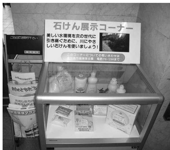
● 石けん展示コーナー（支所等に配置）