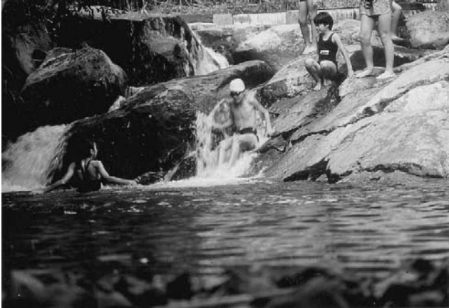
● 宮川野外活動センターでの親水