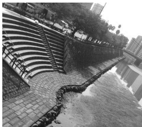
● 親水の階段と散策路