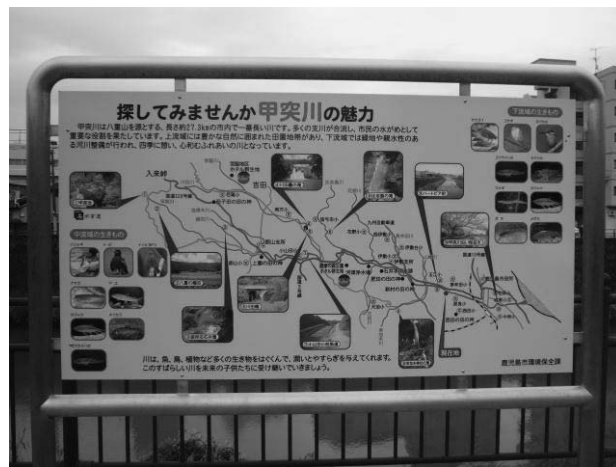
● 河川愛護意識啓発看板