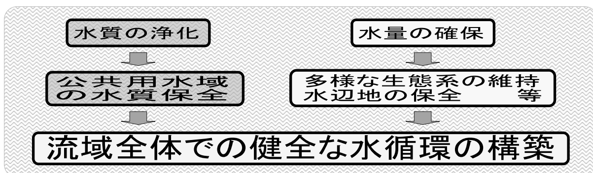
図9-1 合併処理浄化槽の有用性

合併処理浄化槽は、単に水質の浄化にとどまらず、水量が確保できることから、多様な生態系の維持、水辺地の保全等、「流域全体での流れの視点」として環境保全上「健全な水循環の構築」にとっても有用な設備です。