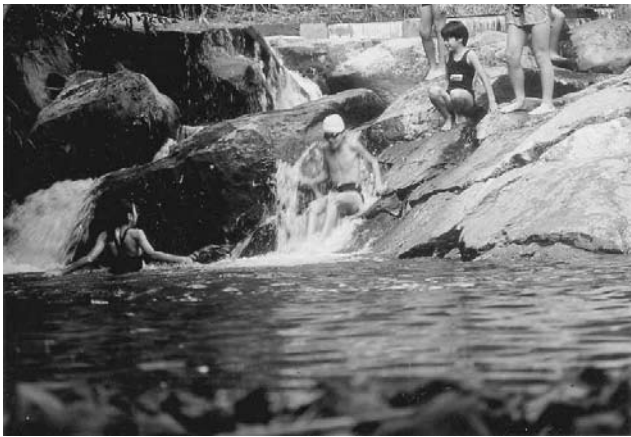
● 宮川野外活動センターでの親水