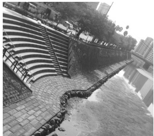
● 親水の階段と散策路