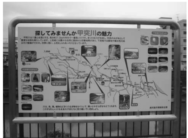
● 河川愛護意識啓発看板