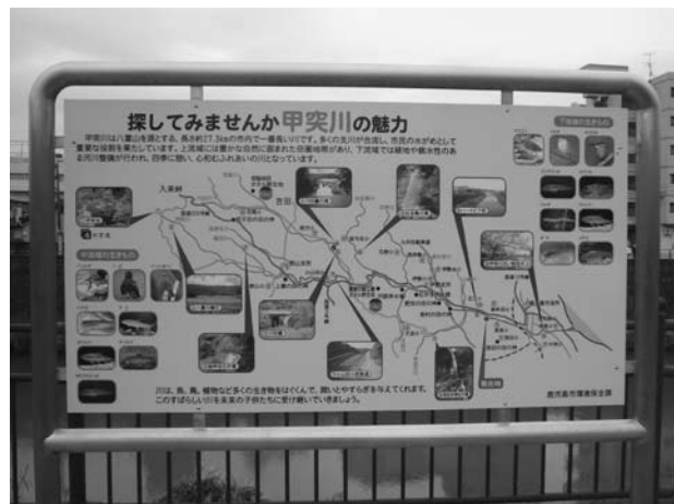
● 河川愛護意識啓発看板