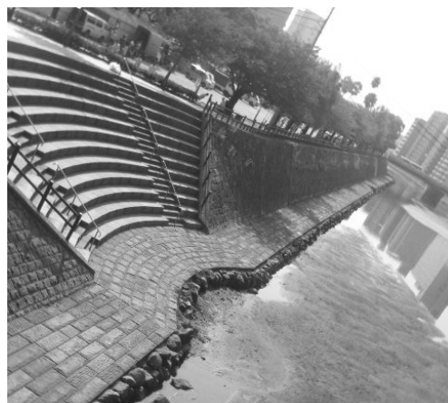
● 親水の階段と散歩路