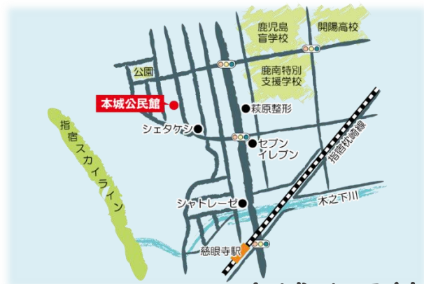
本城公民館 西谷山3丁目8-12