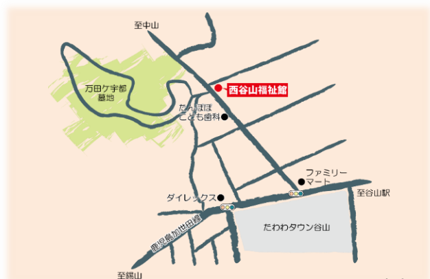
西谷山福祉館 上福元町5740-2