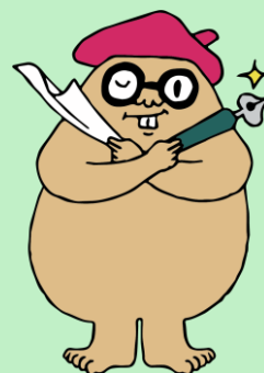
マグマシティPRキャラクター 火山の妖精 マグニオン